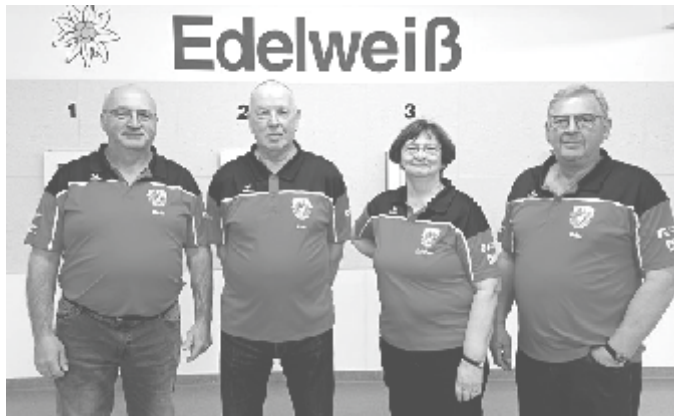
Abb. 1 Die Teilnehmer der Bezirksmeisterschaften: Die Teilnehmer der Bezirksmeisterschaften: